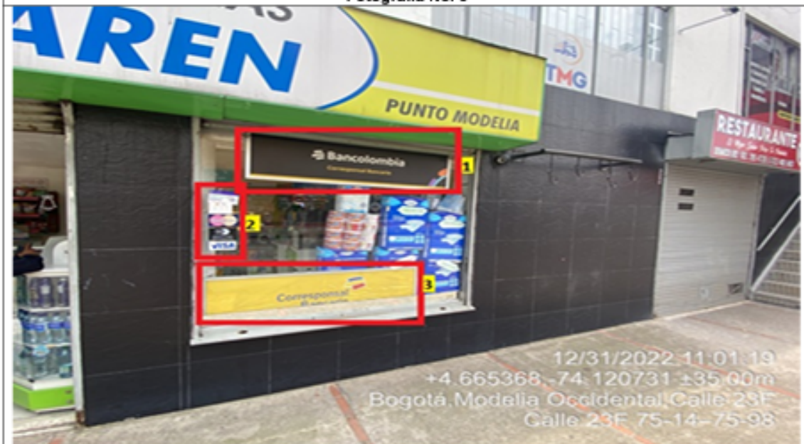
Fotografía No. 5

En la cual se evidencian tres (3) elementos publicitarios pertenecientes al establecimiento comercial DROGUERÍAS DAREN , los cuales se encuentran incorporados en las ventanas de la edificación y son adicionales a los únicos elementos permitidos (avisos en fachada uno por calle y otro por carrera).